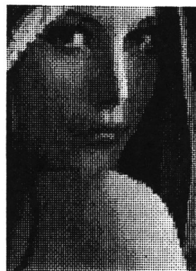
Figura 3 : Detalhe da imagem LENA codificada através da técnica QV classificada.

A Figura 3 mostra a mesma área da imagem LENA exibida na Figura 1, porém desta vez aplicando a QV classificada com 0,5 bit/pixel. Esse exemplo ilustra como esta técnica consegue lidar melhor com os detalhes pertencentes à imagem, proporcionando, com isso, uma qualidade subjetiva global superior.