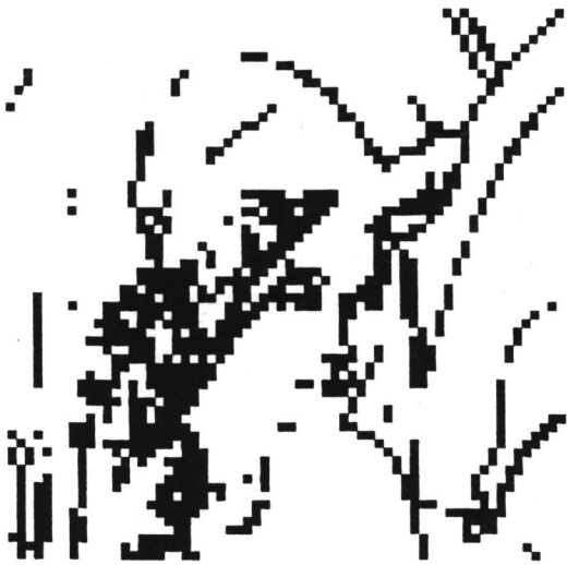
Figura 2 : LENA original e com os detalhes ressaltados.

O desempenho do codificador BTC usando QV classificada do plano de bits é apresentado na Tabela 2 para diversos valores de L e diferentes imagens de teste (não incluídas na seqüência de treinamento).